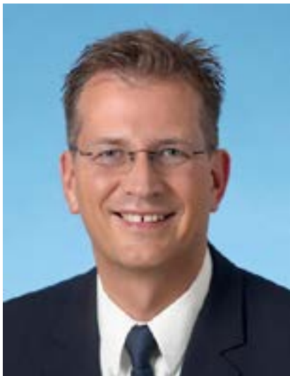
Dr. Ralf Brauksiepe Parlamentarischer Staatssekretär bei der Bundesministerin der Verteidigung

Die Mitbestimmung ist tief in der Werteordnung der Bundesrepublik Deutschland verankert. Die Beteiligung der Soldatinnen und Soldaten gehört zu den Kernelementen der Inneren Führung. Die Möglichkeit, demokratische Prozesse im Truppenalltag zu erfahren, entspricht in besonderer Weise dem Leitbild des Staatsbürgers in Uniform.