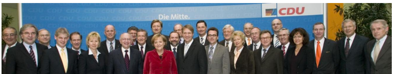
Die kommunalpolitische Zwischenbilanz zeigt, dass sich die Kommunen auf die Bundeskanzlerin verlassen können. Hier sieht man sie im Kreis von Oberbürgermeistern der CDU im Konrad-Adenauer-Haus in Berlin.

Hintergrund ist, dass seit 1999 – dem Inkrafttreten der EU-Führerscheinrichtlinie – mit der neuen Fahrerlaubnis Klasse B nur noch Kraftfahrzeuge bis zu 3,5 Tonnen gefahren werden dürfen. Diese Entwicklung führte zu einem sich zuspitzenden Problem für Feuerwehren und Rettungsdienste. Betroffen sind unter Einbeziehung der Hilfeleistungsorganisationen etwa 100.000 Führerscheininhaber.