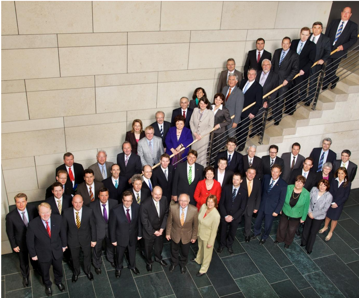
Die Arbeitsgemeinschaft Kommunalpolitik der CDU/CSU-Bundestagsfraktion in der 17. Wahlperiode des Deutschen Bundestags (Fotos: Link).