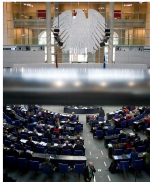
In der sogenannten Haushaltswoche vom 19. bis 23. November 2012 beschloss der Deutsche Bundestag den Bundeshaushalt 2013.

Nachdem es Kulturstaatsminister Bernd Neumann gelungen ist, den Kulturhaushalt achtmal in Folge auf 1,27 Milliarden Euro zu erhöhen, wird dies noch einmal durch die Erhöhung der Haushaltspolitik der Koalitionsfraktionen im Bundestag getoppt. Der Gesamtetat 2013 wird 1,28 Milliarden Euro betragen.