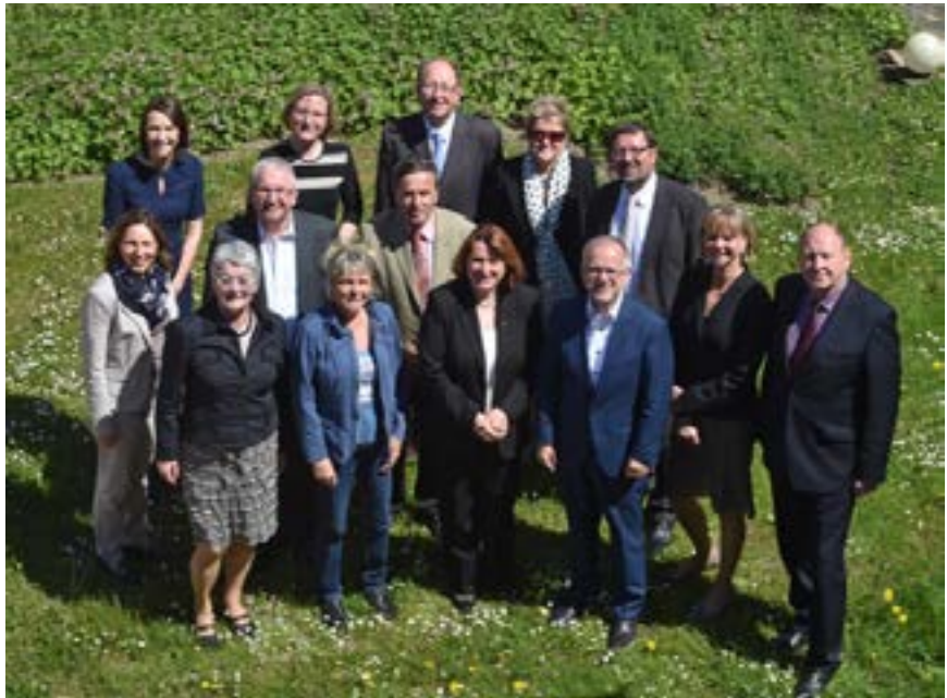
Bild: Die Vorsitzende des Tourismusausschusses des Deutschen Bundestages, Heike Brehmer, mit weiteren Abgeordneten zu Gast beim Landestourismusverband Sachsen

Dabei wurde deutlich, dass der Tourismus in Sachsen in den vergangenen Jahren spürbar Fahrt aufgenommen hat. Sachsen trägt mit zahlreichen kulturellen Schätzen, historischen Sehenswürdigkeiten und einzigartigen Landschaften zur gesteigerten Qualität seines Tourismusprofils bei. Mit der landeseigenen Tourismusstrategie 2020 soll eine nachhaltige, positive Entwicklung des Wirtschaftszweiges in Sachsen langfristig gesichert werden. Dies ist von großer Bedeutung für den ländlichen Raum, denn hier schafft und erhält der Tourismus standortgebundene, nicht exportierbare Arbeitsplätze und