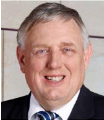
Staatssekretär Karl-Josef Laumann Patientenbeauftragter und Pflege- bevollmächtigter der Bundesregierung CDA-Bundesvorsitzender

Der demografische Wandel hat vielfältige Auswirkungen auf unsere Gesellschaft. Eine davon ist: Wir Deutschen werden immer älter. Das ist gut so. Zur Wahrheit gehört aber auch: Mit zunehmendem Alter steigt das Risiko, irgendwann pflegebedürftig zu werden. Darauf müssen wir uns einstellen. Eine Frage muss uns in diesem Zusammenhang ganz besonders beschäftigen: Wie gelingt es uns, auch in Zukunft genügend, vor allem junge Menschen für den Pflegeberuf zu gewinnen? Die zentrale Antwort darauf lautet: Wir müssen diejenigen, die sich tagtäglich um unsere Pflegebedürftigen kümmern, unterstützen, entlasten und ihnen deutlich mehr Anerkennung entgegenbringen.