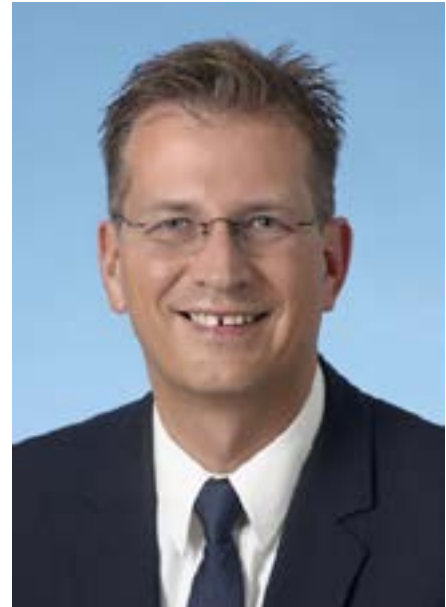
Dr. Ralf Brauksiepe Parlamentarischer Staatssekretär bei der Bundesministerin der Verteidigung

Ein weiterer Bestandteil der Attraktivitätsoffensive ist das am 22. Mai