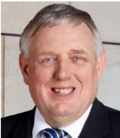
Staatssekretär Karl-Josef Laumann Patientenbeauftragter und Pflege- bevollmächtigter der Bundesregierung CDA-Bundesvorsitzender

Der demografische Wandel hat vielfältige Auswirkungen auf unsere Gesellschaft. Eine davon ist: Wir Deutschen werden immer älter. Das ist gut so. Zur Wahrheit gehört aber auch: Mit zunehmendem Alter steigt das Risiko, irgendwann pflegebedürftig zu werden. Darauf müssen wir uns einstellen. Eine Frage muss uns in diesem Zusammenhang ganz besonders beschäftigen: Wie gelingt es uns, auch in Zukunft genügend, vor allem junge Menschen für den Pflegeberuf zu gewinnen? Die zentrale Antwort darauf lautet: Wir müssen diejenigen, die sich tagtäglich um unsere Pflegebedürftigen kümmern, unterstützen, entlasten und ihnen deutlich mehr Anerkennung entgegenbringen.