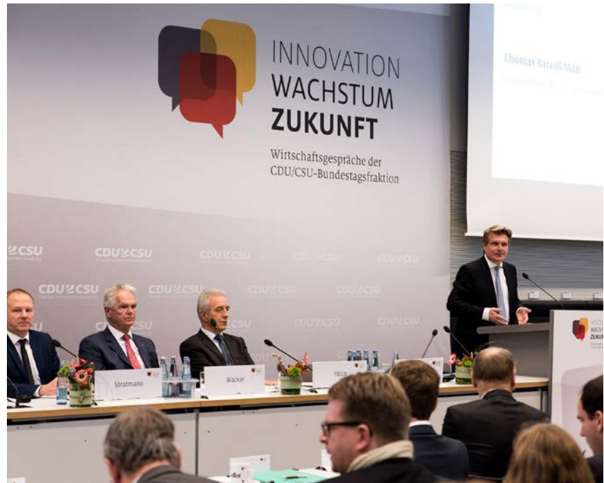
Thomas Bareiß redet über Chancen und Herausforderungen der Energiewende

Auch Sachsens Ministerpräsident Stanislaw Tillich forderte einen marktgerechten Ausbau der erneuerbaren Energien mit Augenmaß. Überdies müsse der Netzausbau beschleunigt, die Netzentgelte müssten harmonisiert werden. Tillich betonte gleichzeitig die Bedeutung der Braunkohle für das Gelingen der Energiewende: „Wir produzieren so viel Strom wie nie zu-