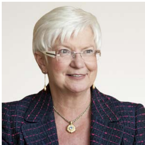
Gerda Hasselfeldt Erste Stellvertretende Vorsitzende der CDU/CSU-Bundestagsfraktion

Die Flüchtlingskrise überlagert derzeit alles: mit der Größe der Herausforderung, mit der Dringlichkeit, mit der Komplexität der Ursachen. Wir können das Problem nur lösen, wenn wir an vielen Stellen und auf verschiedenen Ebenen ansetzen. Genau das tun wir. Die Bretter, die es zu bohren gilt, sind bedauerlicherweise sehr dick. Umso wichtiger werden die Dinge, die wir auf der Haben-Seite verbuchen können. Mit dem Gesetz zur Beschleunigung der Asylverfahren und den Änderungen beim Bleiberecht haben wir in den vergangenen Wochen wichtige Projekte auf den Weg gebracht. Es ist die größte Asylrechtsverschärfung der vergangenen 25 Jahre. Wir dürfen nicht müde werden, das zu betonen. Dazu gehört die Einstufung weiterer Länder des westlichen Balkans als sichere Herkunftsstaaten. Das hat bereits konkrete Ergebnisse gebracht: Der Zustrom aus diesen Ländern ist in den vergangenen Wochen drastisch zurückgegangen.