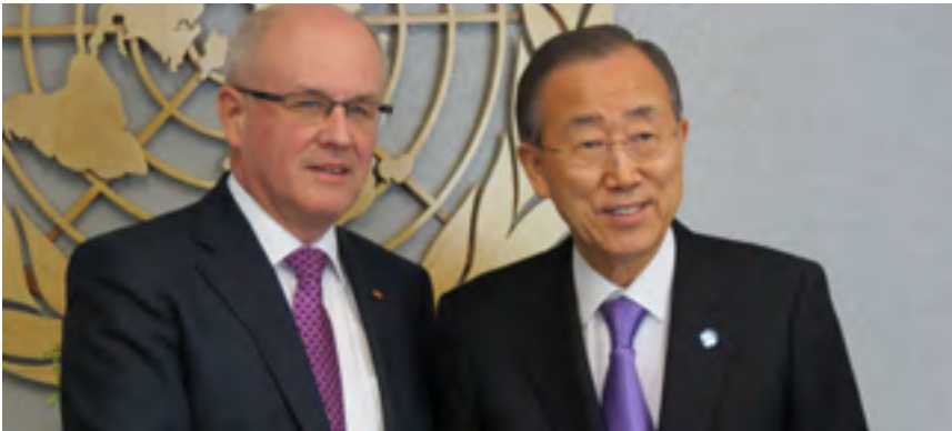
Kauder wirbt bei UN-Generalsekretär Ban Ki Moon für die Religionsfreiheit

Quelle: ständige Vertretung Deutschlands bei den Vereinten Nationen