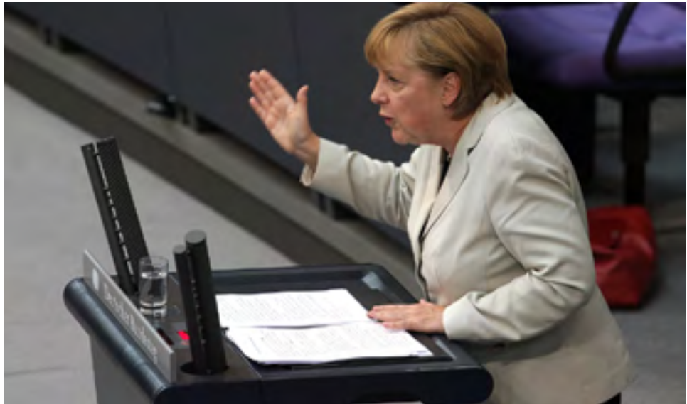
Angela Merkel während der Generaldebatte

In ihrer Rede ging Merkel auch auf die aktuelle Situation in Europa ein. So begrüßte sie die Entscheidung des