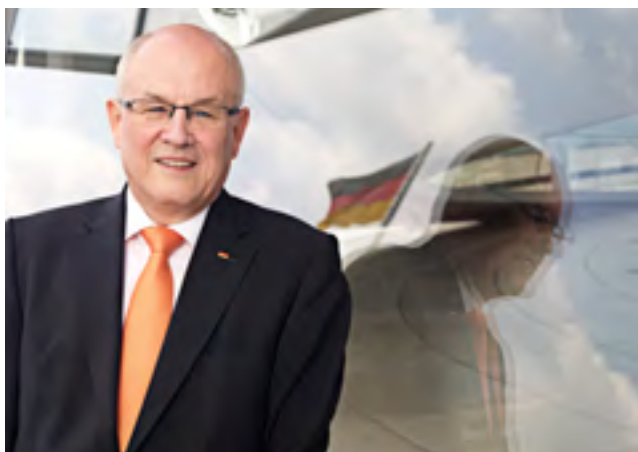
Volker Kauder MdB Vorsitzender der CDU/CSU-Bundestagsfraktion

Die Entscheidung des Bundesverfassungsgerichts zum Europäischen Stabilitätsmechanismus (ESM) ist ein weiterer wichtiger Schritt zur Überwindung der Euro-Schuldenkrise. Es steht nun fest, dass der ESM in absehbarer Zeit in Kraft treten kann. Karlsruhe hat damit den Kurs der Koalition bestätigt. Mit dem ESM wird die Währungsunion dann über ein geeignetes Instrument verfügen, um Euro-Staaten in Not helfen zu können. Damit müssten nun zum Beispiel bei manchen US-Bankern die Zweifel darüber beseitigt sein, dass die Euro-Staaten ihre Währung auch wirklich gegen Spekulationen verteidigen wollen.