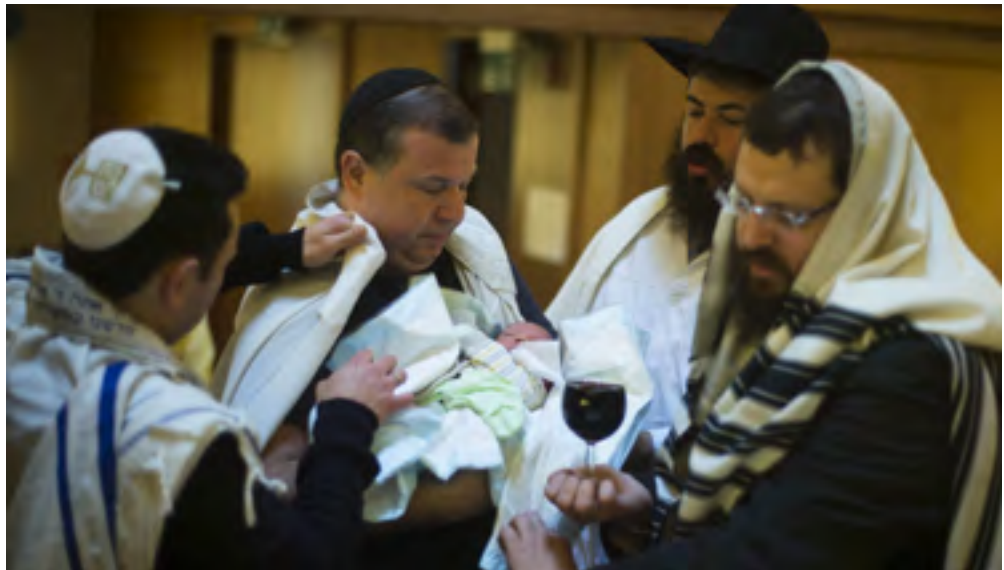
Ein acht Tage alter Junge nach seiner Beschneidung in einer Berliner Synagoge

Mit dem Kölner Landgericht hatte erstmals ein deutsches Gericht die rituelle Beschneidung, die für Muslime und Juden von essenzieller religiöser Bedeutung ist, in Frage gestellt. In Deutschland war die Beschneidung bisher stets erlaubt. Nach dem Urteil fürchteten Juden und Muslime um die Zukunft ihres religiösen Lebens in Deutschland. Deshalb hatte sich der Bundestag schon am 19. Juli mit großer Mehrheit für eine gesetzliche Regelung ausgesprochen, die in verfas-