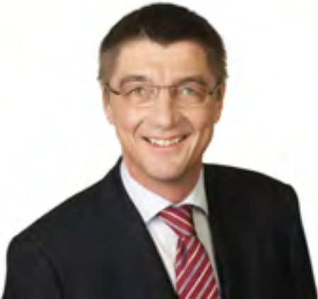
Andreas Schockenhoff Stellvertretender Vorsitzender der CDU/CSU-Bundestagsfraktion

Der Russlandbeauftragte der Bundesregierung und stellvertretende Vorsitzende der Unionsfraktion, Andreas Schockenhoff, hat in der vergangenen Woche am „Petersburger Dialog“ – einem Gesprächsforum mit Vertretern der russischen und deutschen Zivilgesellschaft – teilgenommen. Über seine Kritik an den jüngsten politischen Entwicklungen in Russland und über den Entschließungsantrag der Koalition dazu sprach „Fraktion direkt“ mit ihm.