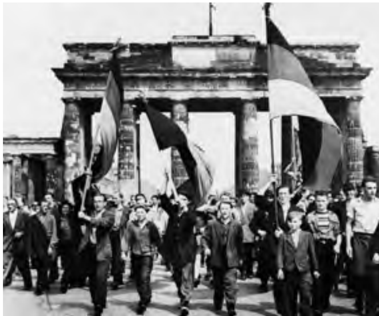
Demonstranten gehen durchs Brandenburger Tor