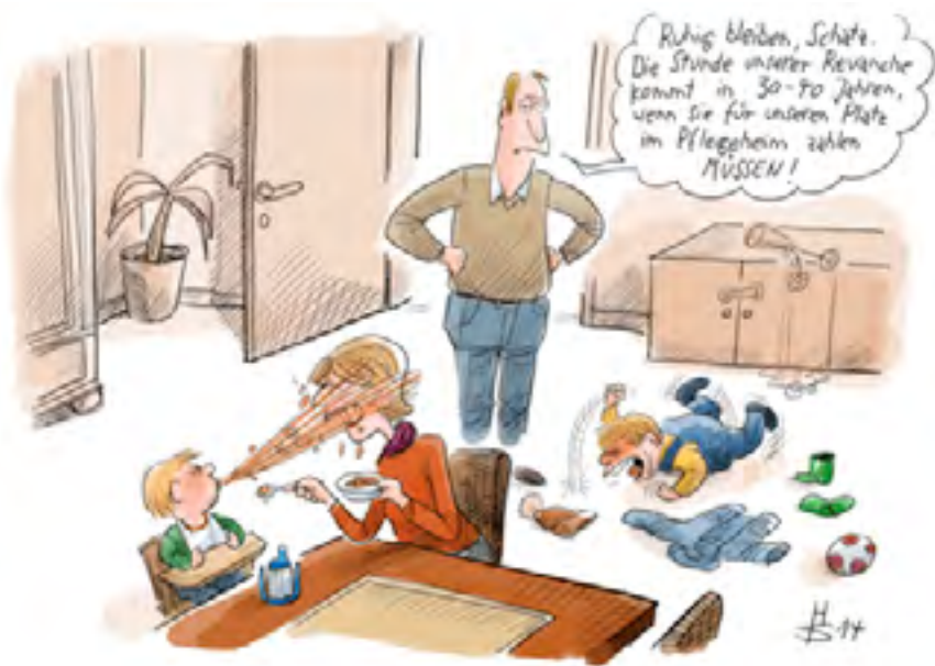
Der sogenannte Generationenvertrag

Insgesamt setzten 6,1 Millionen junge Menschen 2012 ihre Ausbildung nach der Sekundarstufe I im schulischen oder beruflichen Bereich fort. Das waren ein Prozent mehr als im Vorjahr und sechs Prozent mehr als 2006. Während die Zahl der Teilnehmer an einer beruflichen Ausbildung im Vergleich zu 2006 um fünf Prozent sank, nahm die Zahl der Schüler, die im Sekundarbereich II eine Studienberechtigung anstrebten, um 16 Prozent und die Zahl der Studierenden um 25 Prozent zu. Die unterschiedliche Entwicklung in den Bildungsbereichen wird durch den demografischen Wandel, Veränderungen auf dem Ausbildungsmarkt sowie die Tendenz zur Höherqualifizierung beeinflusst.